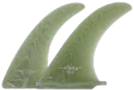
Hobie DP Hobie Log

Hobie DP Flex Volan 7.75" 110081305759 税込¥18,100(税抜¥16,455) 8.25" 110081305760 税込¥19,000(税抜¥17,273) 8.75" 110081305761 税込¥19,500(税抜¥17,727) 9.25" 110081305762 税込¥20,000(税抜¥18,182)