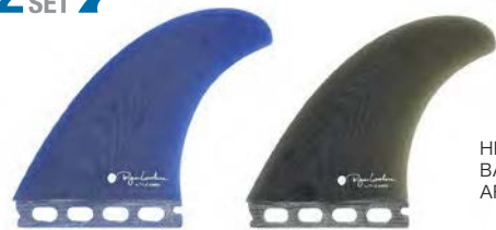
Blue (Raw) 110081305823