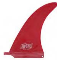
Solid Red (Raw)

Troy Elmore Egg 8.0" 110081305716 税込¥14,400(税抜¥13,091)