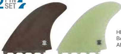
Brown (Raw) 110081305812