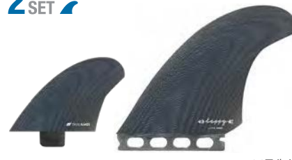
Canard Smoke (Raw)