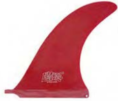
Solid Red (Raw)

Troy Elmore Pivot 10.0" 110081305715 税込¥17,200(税抜¥15,636)