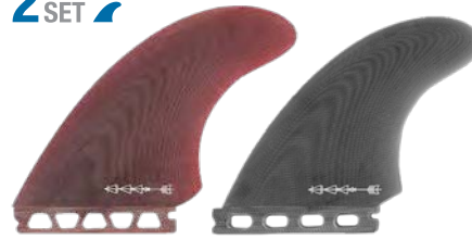
Twin Red (Raw)