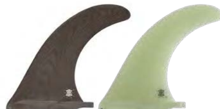
Brown (Raw) 110081305812